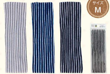
3308 ボーダーヘアバンド/M(ヘッダー付)