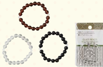
0958-01 数珠プレスレット大玉 (紙台紙袋入)