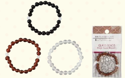
0958-02 数珠プレスレット小玉 (紙台紙袋入)