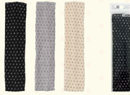
3245 水玉ヘアバンドS/竹炭入り(ヘッダー付)