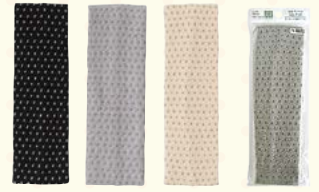
3246 水玉ヘアバンドM/竹炭入り(ヘッダー付)