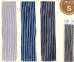
3307 ボーダーヘアバンド/S(ヘッダー付)