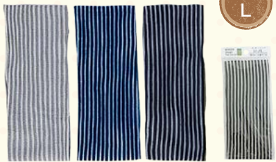
3309 ボーダーヘアバンド/L(ヘッダー付)