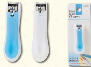
7646 ミニ爪ぎり (スライドブリスター)