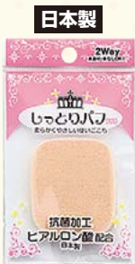
7540 しっとりパフ / 長角型 (ヘッダー付)

□入数 12×箱数 75/900 □重量 4.0kg □C/S 480×330×420mm □原産国 J (表示有) □材質 NBR (合成ラテックス) □備考 約 53×45×7mm