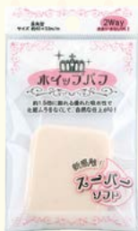
7453 ホイップパフスーパーソフト/長角型(ヘッダー付)

□入数 12×箱数 75/900 □重量 5.5kg □C/S 480×330×380mm □原産国 C (表示有) □材質 親水性ウレタン □備考 約 53×45×8mm ※パフの性質上ロット毎に色の違いがありますが、品質は問題ございません。