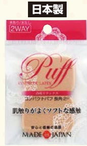
7103 コンパクトパフ/長角2P(ヘッダー付)

□入数 12×箱数 75/900 □重量 5.5kg □C/S 480×330×380mm □原産国 J (表示有) □材質 NBR (合成ラテックス) □備考 約 50×38×6mm