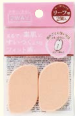
7629 リーフ型パフ 2P (ヘッダー付)

□入数 10×箱数 90/900 □重量 7.2kg □C/S 770×500×200mm □原産国 C (表示有) □材質 合成ゴム □備考 約 62×40×7mm