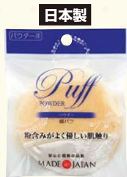
7009 綿パフ (ヘッダー付)

□入数 12×箱数 75/900 □重量 9.0kg □C/S 570×415×520mm □原産国 J (表示有) □材質 綿 100% □備考 直径: 約 85mm 厚み: 約 10mm