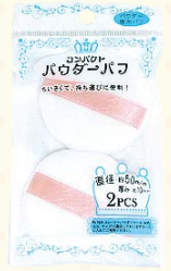
7429 コンパクトパウダーパフ/2P(ヘッダー付)