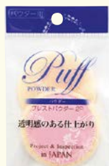
7015 ブレストパウダー /2P (ヘッダー付)

□入数 12×箱数 75/900 □重量 5.5kg □C/S 500×420×350mm □原産国 TH (表示有) □材質 綿 100% □備考 直径: 約 60mm 厚み: 約 5mm