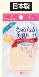
7490 ソフトリストパフ / 長角型 (ヘッダー付)

□入数 12×箱数 75/900 □重量 4.5kg □C/S 480×330×380mm □原産国 J (表示有) □材質 特殊 NBR・スクワラン □備考 約 52×45×8mm