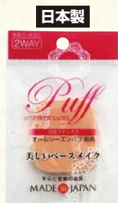
7003 オールシーズンパフ/長角(ヘッダー付)

□入数 12×箱数 75/900 □重量 4.0kg □C/S 480×330×420mm □原産国 J (表示有) □材質 NBR (合成ラテックス) □備考 約 52×45×8mm