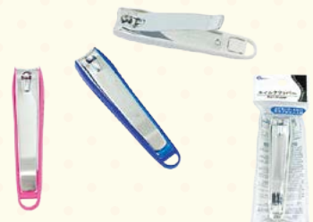
7065 ネイルクリッパー(爪切り)(ヘッダー付)