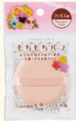
7589 もちもちパフ (ヘッダー付)