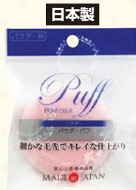
7040 パウダーパフ (ヘッダー付)

□入数 12×箱数 75/900 □重量 5.5kg □C/S 600×515×460mm □原産国 J (表示有) □材質 本体: ウレタン・ナイロン リボン: ナイロン □備考 直径: 約 70mm 厚み: 約 15mm