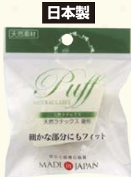
7126 天然ラテックス / 菱型 (ヘッダー付)

□入数 12×箱数 75/900 □重量 9.0kg □C/S 630×425×580mm □原産国 J (表示有) □材質 NR (天然ラテックス) □備考 約 71×53×25mm