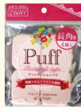
7593 ファンデーションパフ長角型/4P(ヘッダー付)